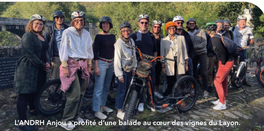
L'ANDRH Anjou a profité d'une balade au cœur des vignes du Layon.