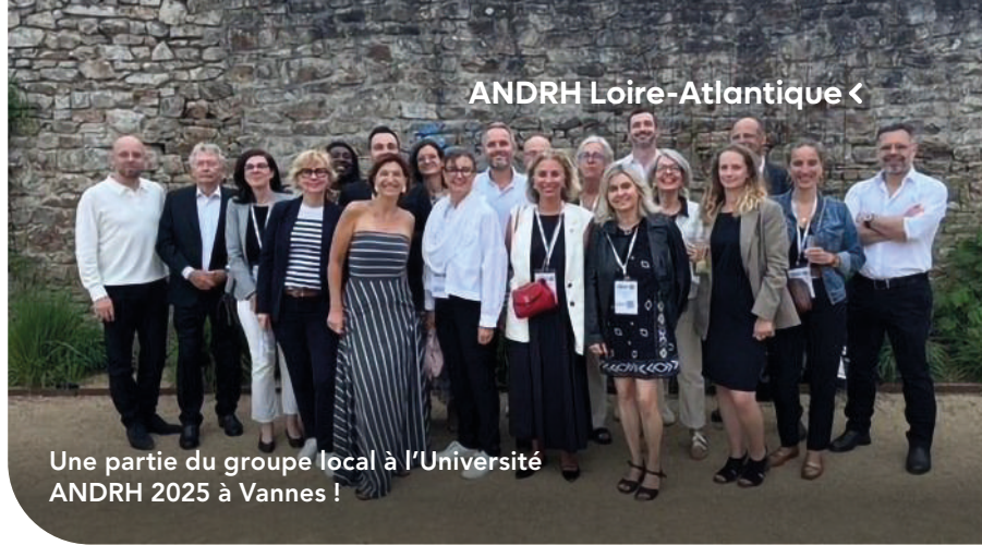
Une partie du groupe local à l'Université ANDRH 2025 à Vannes !

C. R. : C'est créer du lien, ouvrir son esprit, adopter une vision à 360° sur la fonction RH. C'est une source d'enrichissement quotidien, et il est rassurant de savoir que l'on dispose d'un support solide, notamment en