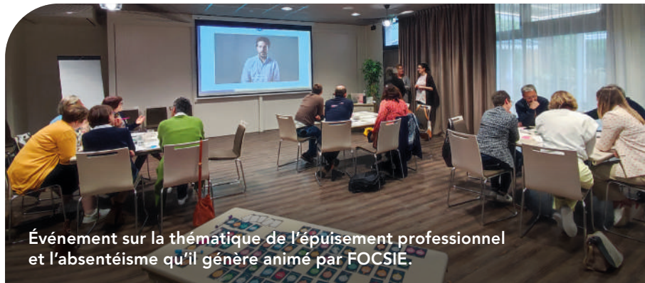
Événement sur la thématique de l'épuisement professionnel et l'absentéisme qu'il génère animé par FOCISIE.

A.H. : Notre objectif est de satisfaire nos adhérents en leur proposant des réunions mensuelles articulées autour de trois types d'activités : l'intervention d'experts pour nous