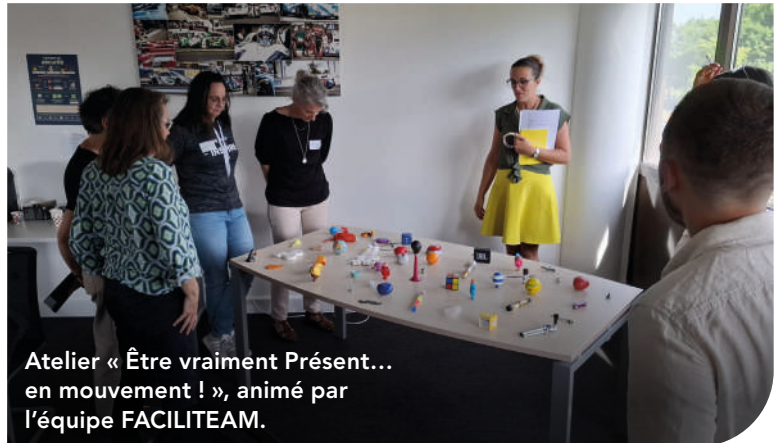
Atelier « Être vraiment Présent... en mouvement ! », animé par l'équipe FACILITEAM.

« Nous cherchons à nous adapter au mieux au marché et trouver des solutions pour rester attractifs. Pour chaque métier, nous devons analyser et proposer des alternatives innovantes pour rester dans la course ! »